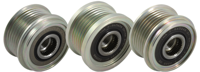
Kuva 2: Laturin vapaapyörä 535 0063 10 (vasemmalla), 535 0202 10 (keskellä), 535 0203 10 (oikealla)

Edellä esitetyissä laturin kiinteällä hihnapyörällä varustetuissa autoissa voi apulaitekäytön alueella ilmetä tärinää ja häiritsevää melua. Tämän syynä on dieselmoottoreiden pyörimisnopeuden huomattavasti suurempi epätasaisuus bensiinimoottoreihin verrattuna.